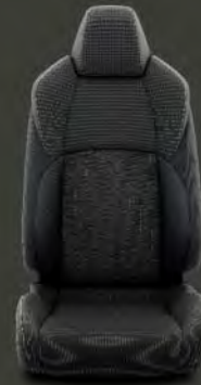
Tapicería tela negra Estándar en acabados Active, Active Tech y Feel!