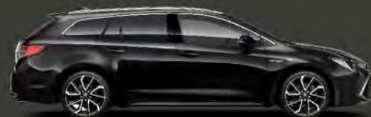
209 Negro Azabache*