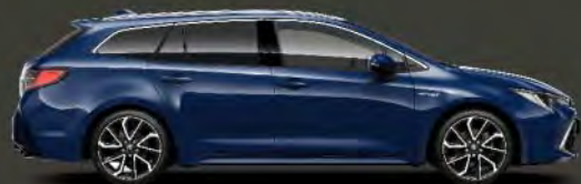
8Q4 Azul Oceáno