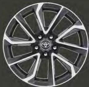
Llantas de aleación 18" Bi-tono Estándar en acabados Feel! 180H y Advance