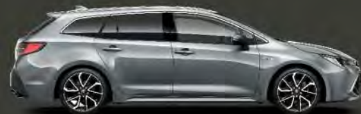
1H5 Gris Manhattan*