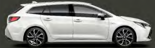
040 Blanco Classic