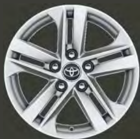
Llantas de aleación 16" Estándar en acabados Business Plus, Active y Active Tech