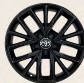
Llantas de aleación 17" negras Opcionales a todos los acabados