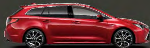
3U5 Rojo Emoción §