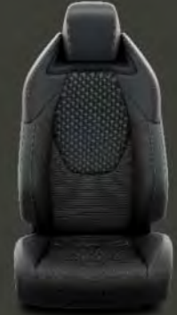
Tapicería tela, cuero y Alcantara® Estándar en acabado Advance