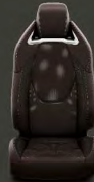
Tapicería cuero marrón Estándar en acabado Advance Luxury Marrón