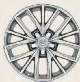
Llantas de aleación 17" Opcionales a todos los acabados