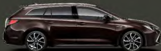
4W9 Marrón Espresso*