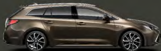
6X1 Bronce Oliva*