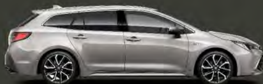
1J6 Plata Polar §