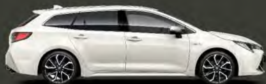
070 Blanco Perlado §