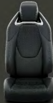
Tapicería cuero negro Estándar en acabado Advance Luxury Negro