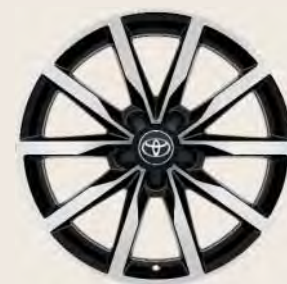
Llantas de aleación 18" Bi-tono Opcionales a todos los acabados