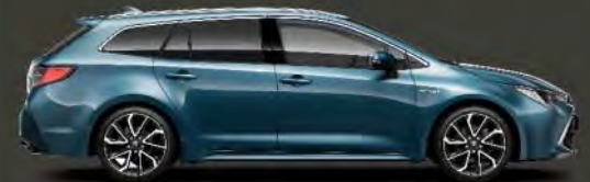
8U6 Azul Denim*