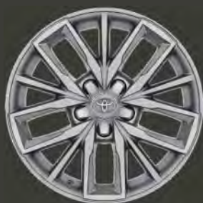
Llantas de aleación 17" Estándar en acabado Feel! motor 125H