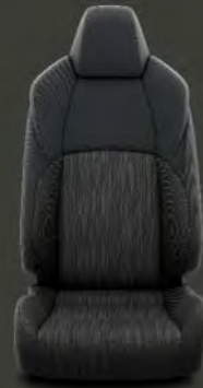
Tapicería tela gris/negro Estándar en acabado Business Plus