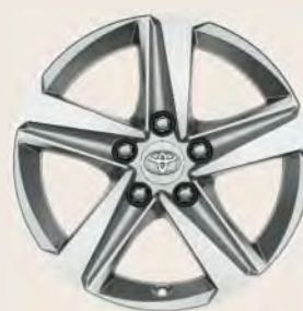
Llantas de aleación 16" 5 radios Opcionales a todos los acabados