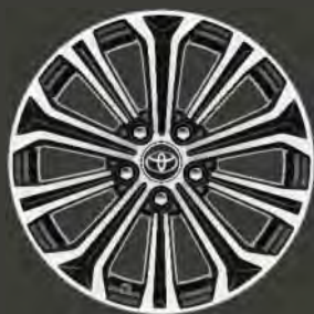
Llantas de aleación 17" Bi-tono 10 radios Opcionales en todos los acabados